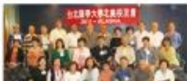
▲ 熱鬧歡樂之餐後會議與合影

北醫北美校友年會100年8月27日至9月3日於風光明媚的阿拉斯加舉行，守護代表北醫醫學系醫友會參與此年度盛會，8月27日飛往溫哥華，登上Me. Zuiderdam郵輪，