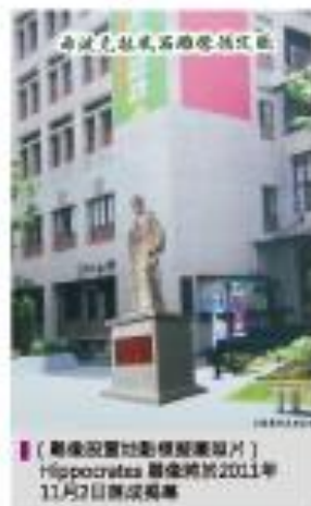
（雕像設置地點與落成照片） Hippocrates 雕像將於2011年11月2日落成揭幕

醫師誓言是我們永遠的堅持與驕傲，11月2日上午十時，歡迎所有醫友共襄盛舉，參與50年校園中矗立起將傳承幾世紀豐碑的典禮，讓醫友們且與先哲並立，留下歷史，未來，當北醫學子們漫步於杏林殿堂時，一定會看到所有學長姐的殷殷叮囑。