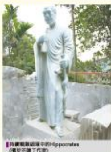
【持續雕刻過程中的Hippocrates (位於花蓮工作站)】

本會為慶祝北醫創校五十週年校慶所捐贈的Hippocrates雕像即將完工，即日起開始接受醫友預約捐款，每位88,000元，有意捐款者請儘快報名並完成匯款，10月31日截止。