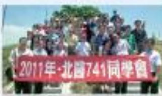
▲ 741同學會台南四草濕地自來

北醫741的同學已經相識26年，民國74年一屆年輕人帶著熱血與從風來到海山山下的北醫醫學系就讀。民國81年畢業後，轉眼過了19年，自從去年