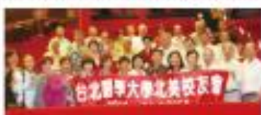
▲ 北美校友於南區大廳合影紀念